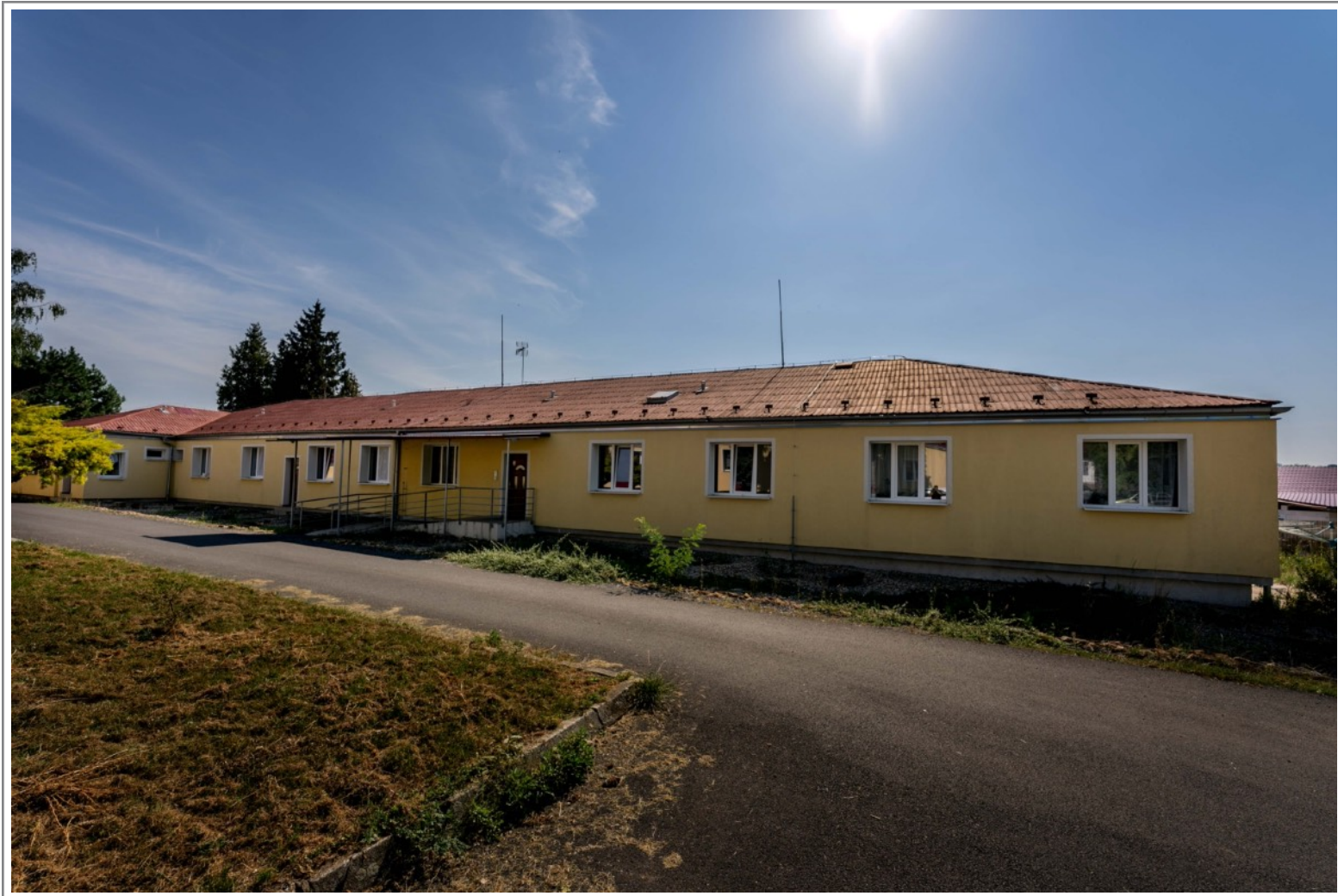
Fotografie dům Fanda