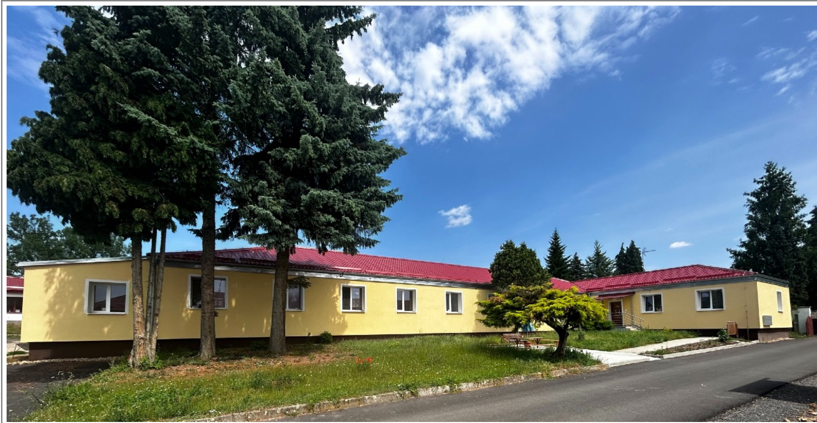
Fotografie dům - Natálie